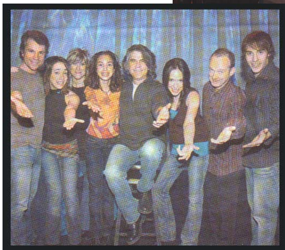
Spectacle de Richard Séguin